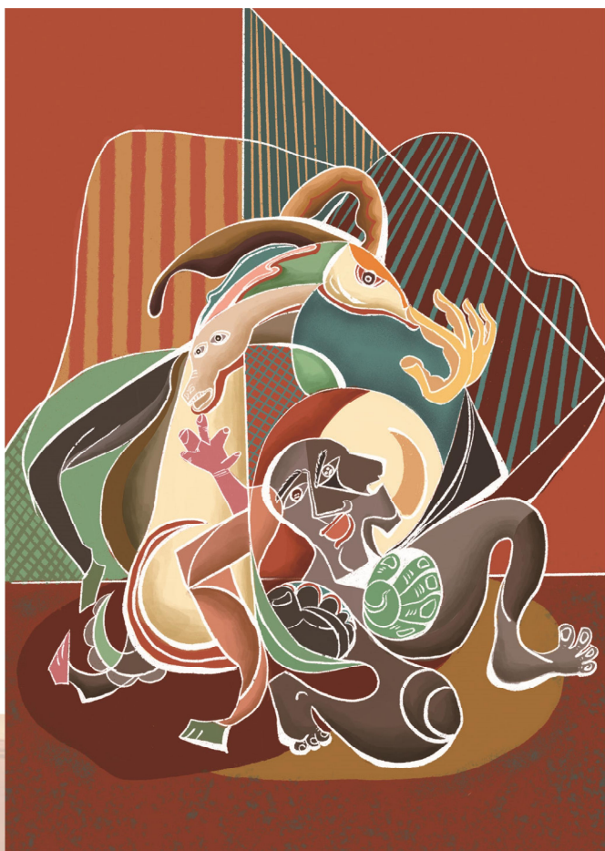
佳作奖 时空 赵怡迪