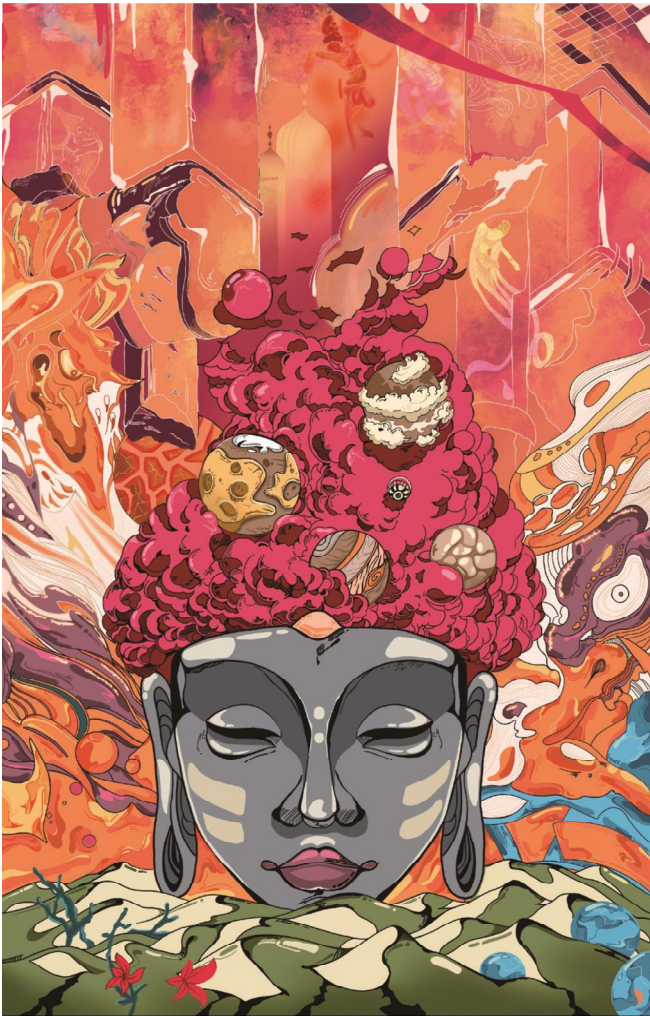
优秀奖 奇幻敦煌 李禄灿