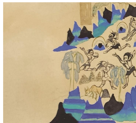
佳作奖 敦煌壁画临摹 张晓晓