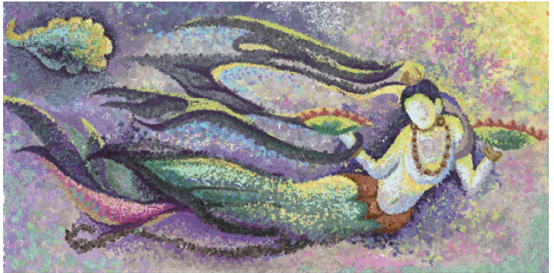
佳作奖 印象派 祁名宇