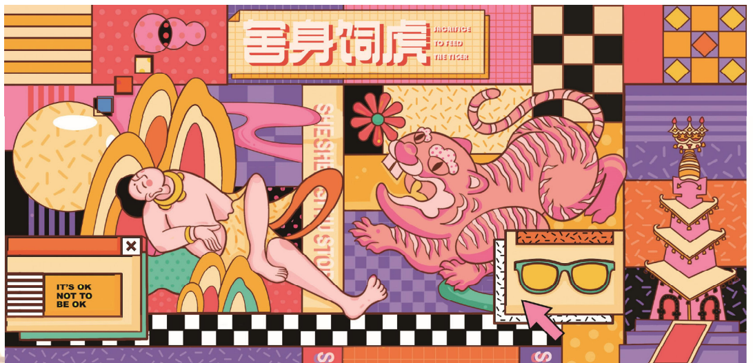
佳作奖 印象敦煌 袁敬雅