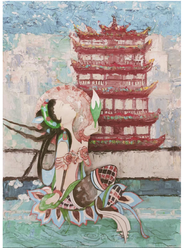
优秀奖 千年莫高 徐萌蔚