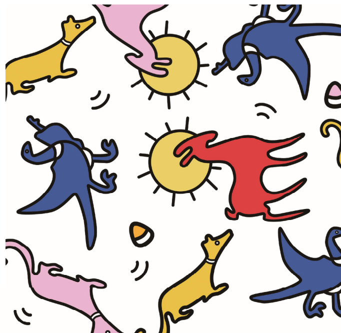
佳作奖 敦煌壁画动物装饰画 庞宇杰